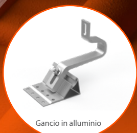
Gancio in alluminio

È possibile risparmiare usando un minor numero di ganci in alluminio rispetto ad altri prodotti presenti sul mercato. Se il tetto lo consente, può essere utilizzato il 45% in meno di ganci in alluminio per un comune modulo FV da 120 celle (considerando la capacità di carico standard di 70 kg dei più comuni ganci per tegole).