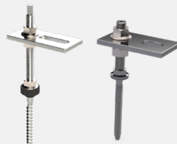
Robust BOLT za jeklene / lesene strukture

Oglejte si kratek video za pomoč pri namestitvi